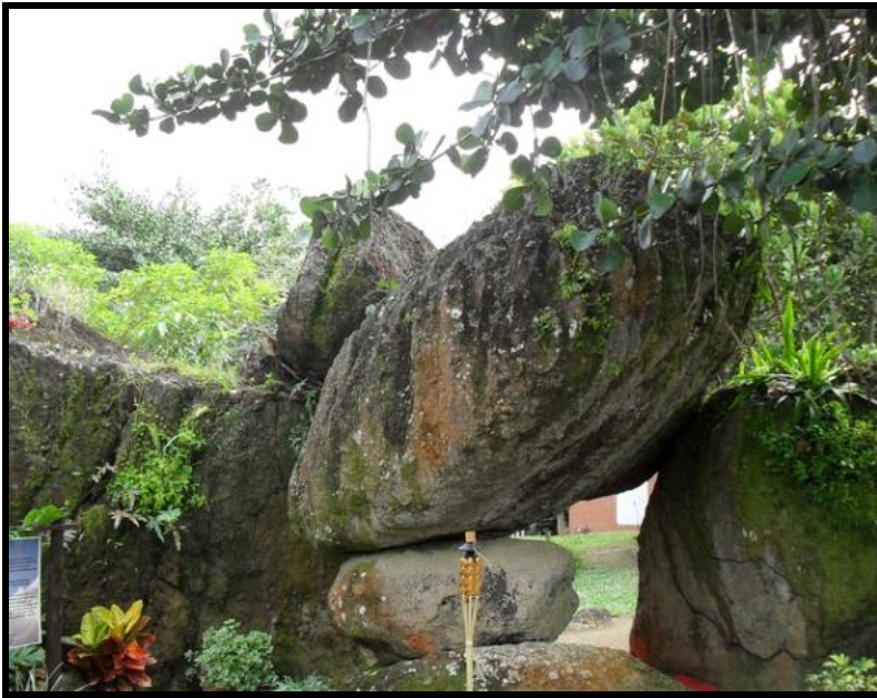
Ilustración 3 La Waka Sagrada, El Cerro del Bohique, Cidra