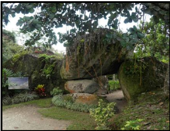
Ilustración 1 La Waka Sagrada, Cerro del Bohique, Cidra

Cuentan antiguas tradiciones orales que allá en un lejano tiempo inmemorial o en el sueño primordial del año tiempo de las guácaras, los sabios viejos Bohíques, cantaban en sus areitos ceremoniales las tradiciones y antiguallas de los abuelos de la isla de la tortuga. ¡Guaca, es el hermano de Dios! ...le decía sabiamente el venerable anciano Bo-guay a los conquistadores sanguinarios, quienes no podían entender en lo más mínimo el lenguaje solapado al cual se refería el anciano. Él les señalaba al sagrado y temible poder de la sublime energía del Guaycán. Es por eso que uno de los nombres de la Madre Divina, o madre del dios del cielo taíno sea Guacar. Ulloa, le llama Guaca (ver: Fray Ramón Pané en su Relación acerca de las antigüedades de los indios , de 1498). Algunos investigadores también relacionan a Waka-iri de wa=nuestra y kairi=luna, como asociación natural con el útero, la luna y los ciclos menstruales. Posiblemente asociado con la marea y el incomprendido menstuo femenino. Evidentemente la Guaca resulta ser una cueva u útero natural de la divina madre Tierra la Atabex. Según Zayas, p.50-edición de 1914 (Indigenismos, Tejera, p.100) “Atabei tenía otro hijo denominado Guaca...”. Un envoltorio sagrado se puede conocer también como guacal o huacal.