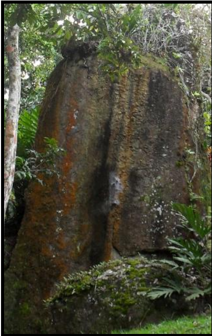
Ilustración 2 Abuela Piedra, Guardián, Cerro del Bohique, Cidra

Existen lugares en el mundo los cuales están cargados de gran poder y sacralidad. La evidencia pétreo en ellos y los artefactos, tanto líticos como arqueológicos, nos evidencian que esto era así para nuestros antepasados indígenas. Estos lugares son muy especiales pues a través de los siglos han servido como portales o centros diseminadores de una clase de energía salutífera y a la vez muy temible por ciertas particularidades energéticas. Ellas contienen y retienen en sí mismas el guacán o el poderoso campo energético del temido poder del médico brujo o, el Bo. Bohique quien es médico herbolario que a la vez encarna el enigmático guay-way-huay, el cual es el maestro del misterio y la transformación física como depositario de la tradición de la T'oa. Fiel portador del bastón o cetro serpentino del poderoso rayo-trueno Huracán Guacán. Toda casa o Bohío debería de tener su bendición ritual entre la tribu. Se conocían algunas de ellas como el Kanei o Caney por residir allí, el poder del Kan. El Bohique era chamán sacerdote, médico o hechicero; poseedor de conocimientos muy específicos de plantas y toda clase de herbolaria e intermediario práctico y experimentado entre la tribu para sus divinidades.