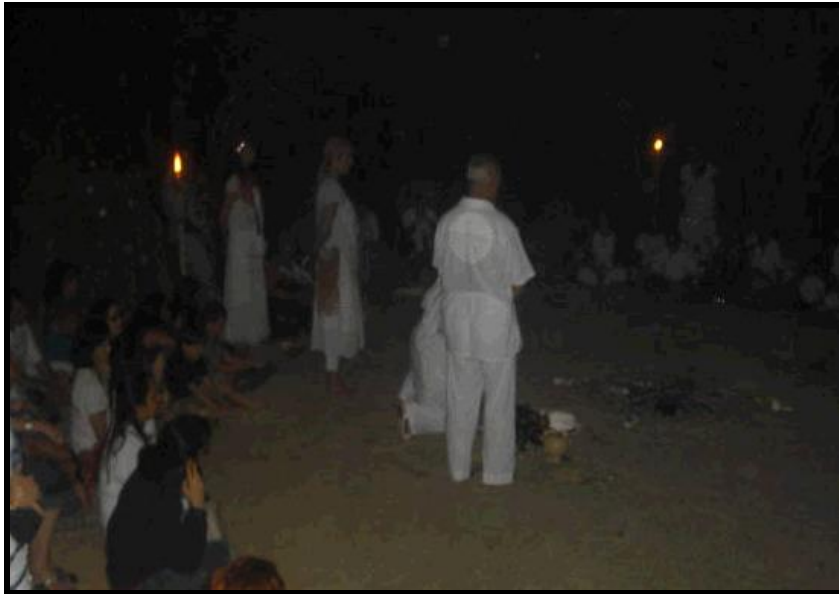
Ilustración 5 Ceremonia de los 10 años, Cerro del Bohique, Cidra

En posteriores Encuentros Indigenistas también este poderoso Centro Ceremonial, fue utilizado por ellos, y en el año 2004 el 26 de abril, el líder indigenista de los Lakotas, David Bald Eagle, tiene a bien consagrarlo ya entonces oficialmente como Sagrado Cerro del Bohique. Es aquí donde Taínos, Lakotas, Mayas y otros grupos tribales, han realizado ceremonias, por ser este el Único Centro Ceremonial activo en todo el Caribe. En marzo del 2010 se celebra entonces una hermosísima ceremonia para conmemorar los diez años de trabajo ceremonial continuo e ininterrumpido y para ampliar la protección de tan sagrado lugar.