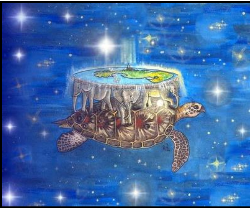
Ilustración 1 Madre Tortuga

Nuestros indígenas bailan al Sol durante muchísimos milenios en la Casa del Agua de La Tortuga Lunar. Ella es nuestra Casa. De su caparazón renace Hun-NA-Yel; Dios del Maíz. Es caparazón hendido de Tortuga, y lugar primigenio de las tres piedras originales del fundamento del primer Fuego Sagrado. ¡Danza Solar! U es luna, mes lunar quien se relaciona al menstruado de mujer, y se asocia con la Luna; su ciclo rítmico, como contadora del tiempo.