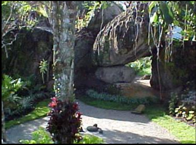
Ilustración 5 Waka Sagrada, Cerro del Bohique, Cidra, Puerto Rico