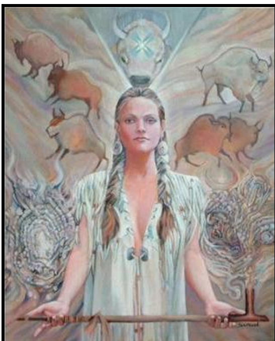
Ilustración 3 Pte-San-Wi

En el sendero de la medicina roja o cangleska wakan, algunas danzas son solares y otras contienen características lunares. La primera mención documental del baile milenario-circular-sagrado de nuestros aborígenes aparece ya documentalmente tan temprano como en 1495 (Nicolas Scillacio, De Insulis Meridiani). Explica el autor las diversas razones que motivaban las danzas indígenas ancestrales. Entre los hermanos Lakotas, el asunto es muy particular. El Sun Dance exige una preparación rigurosísima, y sus instrucciones Originales -dadas por la Divina Mujer Búfalo Blanco (Wohpe o Pte-San Wi)- son verdaderamente muy severas.