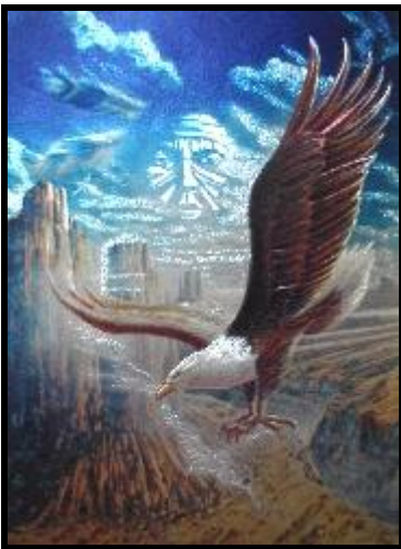
Ilustración 4 Espíritu del Águila

Wabli Gleska, el Espíritu del Águila, es el mensajero del poder de los vientos sagrados de Wakan-Tanka. La ofrenda ceremonial de la Danza Solar, debe ser llevada por ellos, los divinos y emplumados vientos sagrados, en sus aromáticos mensajes-ofrendas del sweetgrass, tabaco, copal y cedro, hasta el Poste Central - Lugar Sagrado, donde reside Wakan Tanka, el Bendito Corazón del Todo. Las purificaciones en el Inipi, son parte de la ardua preparación del guerrero solar. Se canta a las Abuelas piedras: “¡Wakan Tanka usimalaya yo! ¡Wanikta cha lechamun welo!” (¡Gran Espíritu ten Piedad de Mí! ¡Mientras yo continúe viviendo, esto realizare!). Es la milenaria y legendaria danza del A-NA-U-AK, parte del Ritual de la Sociedad Secreta de la Danza (Mdewiwin) y el Sun Dance (Wiwanyag Wachipi) se convierte así, en un ritual severísimo en su forma original.